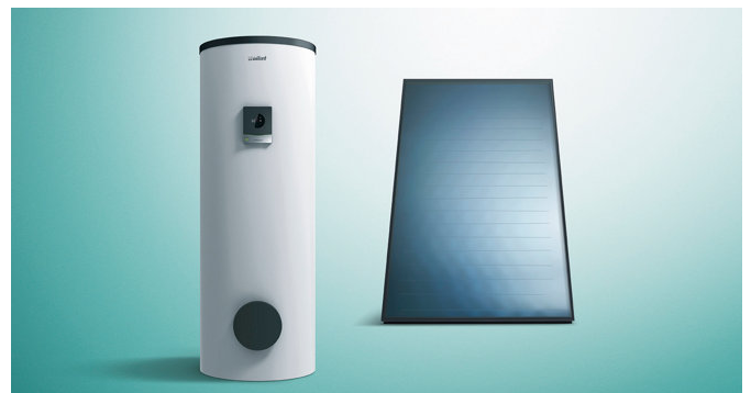
auroSTOR depósito solar, auroTHERM panel solar