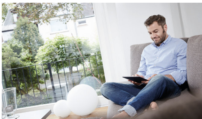
App de sensoCOMFORT se llama "sensoAPP"