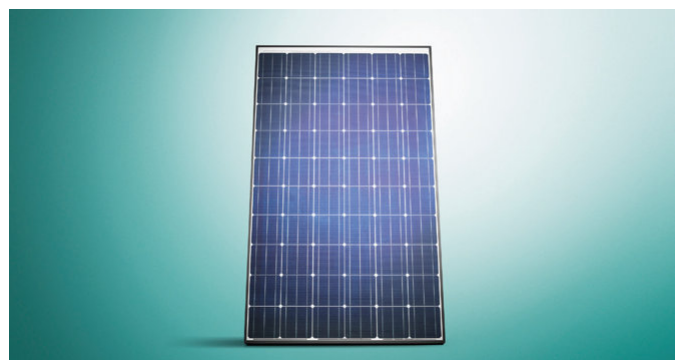
auroPOWER, sistema fotovoltaico