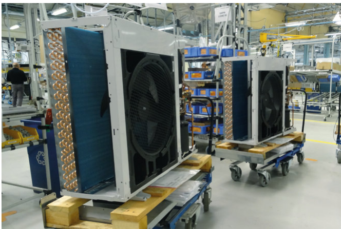
Cada unidad se verifica antes de salir de fábrica