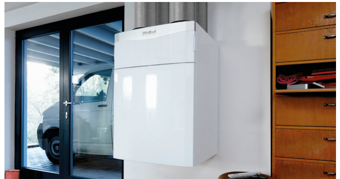
recoVAIR, ventilación doméstica con recuperación de calor