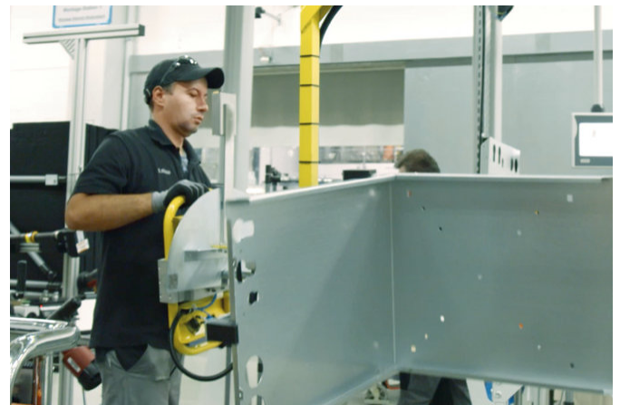
Las bombas de calor son producidas por un equipo altamente cualificado