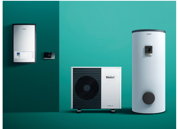
aroTHERM split bomba de calor aire-agua, módulo hidráulico montado en la pared, control MULTIMATIC, uniSTOR depósito para ACS

aroTHERM split es una bomba de calor que ofrece ahorro de energía y confort para su vivienda. Cómo energía gratuita utiliza el calor del aire. El sistema aroTHERM split está compuesto por 2 componentes: la bomba de calor situada en el exterior y una unidad interior.