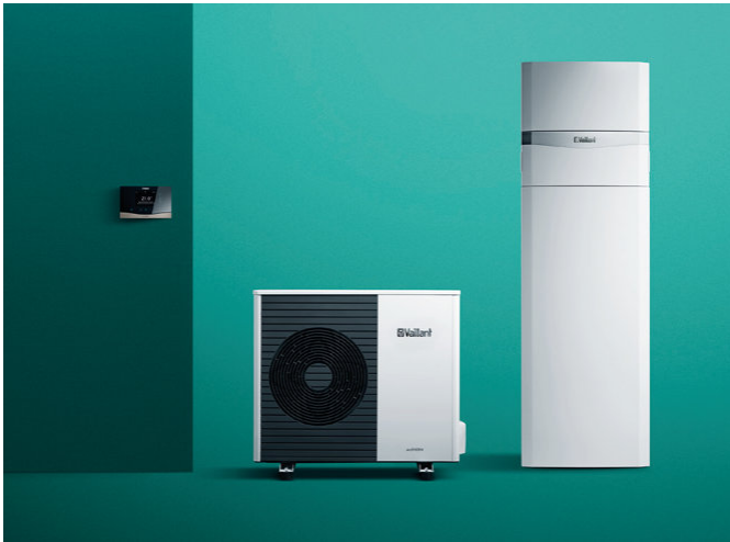
aroTHERM split bomba de calor aire-agua, uniTOWER torre hidráulica