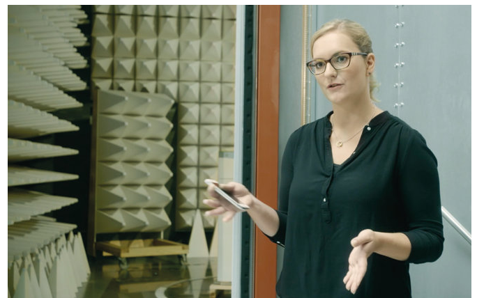
En los tests se simulan intensivamente todas las posibles aplicaciones