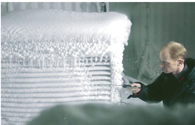
En la sala climática se analizan las unidades exteriores ante condiciones climatológicas extremas